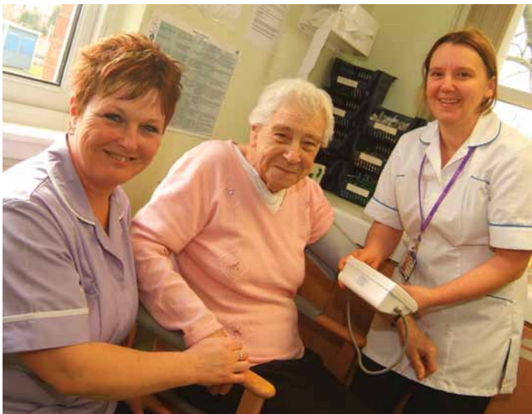
Am Fìor Urramach Ailig Salmond BPA

Cùram Pearsanta is Ban-altraim An-asgaidh agus Cuibhreann Frithealaidh